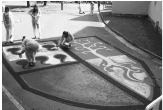
Mobilitätstag am Abteigymnasium Seckau

Im Rahmen des Projektes „Klima und Mobilität“ fand anlässlich der Mobilitätswoche Ende September wieder eine Aktion zum „Autofreien Tag“ statt. Bereits am Morgen gab es eine Straßenmalaktion auf dem Schul-Campus, danach informierten der Kindergarten, die Volksschule und das Abteigymnasium mit dem „CO 2 -freien Klimabus“ die Bevölkerung über Klimawandel und Klimaschutz als Anstoß zum Nachdenken. Vor allem das „Gehzeug“, das den Platzbedarf eines Autos vor Augen führt, machte großen Eindruck.