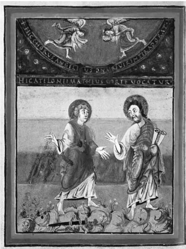
Abbildung entnommen aus: Florentine Mütterich u.a.: Karolingische Buchmalerei, Prestel-Verlag

Die Hörer seiner Botschaft unterscheiden sich durch ihre gegensätzliche Reaktion auf die für sie bestimmten Worte. Die einen sind bereit zu verstehen und anzunehmen, was Jesus ihnen sagt. Die anderen verhalten sich abweisend und lehnen das Gesagte ab. Die Hörerschaft gliedert sich in „Verstehende“ und „Nichtverstehende“, Aufgeschlossene und Verstockte. Matthäus spricht von Menschen, die „weil sie sehen und doch nicht sehen“ (13, 13) in ihrer Verhärtung sich als Blinde und Taube verhalten. Die christliche Gemeinde ruft er auf, sich für das Wort Gottes, das Jesus verkündet, zu öffnen. Er macht ihr bewusst, dass sie berufen ist, die Seligpreisung Jesus auf sich zu beziehen: „Ihr aber seid selig, denn eure Augen sehen und eure Ohren