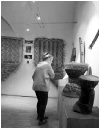
Afrikaausstellung im Mediationsraum