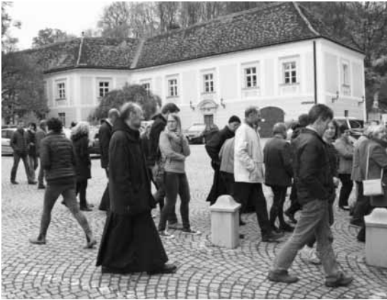
Wallfahrt nach Maria Schutz bzw. Stift Heiligenkreuz

Die jährliche gemeinsame Wallfahrt der Angestellten, der Lehrer des Abteigymnasiums und der Mitarbeiter in der Pfarre mit den Mönchen führte uns am 29. Oktober in das Zisterzienserstift Heiligenkreuz im Wienerwald. Auf der Fahrt dorthin besuchten wir den Wallfahrtsort Maria Schutz am Semmering. Zur Feier der Heiligen Messe durchschritten wir ganz bewusst die dortige Heilige Pforte der Barmherzigkeit, um unsere persönlichen Anliegen Christus zu übergeben.