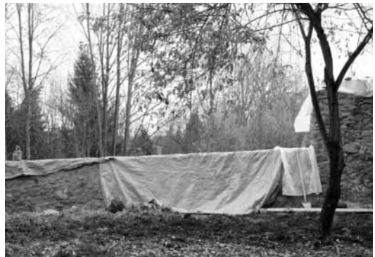
Schäden & Arbeiten an der Klostermauer