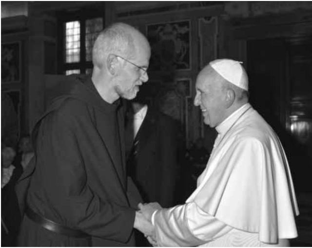
Audienz bei Papst Franziskus