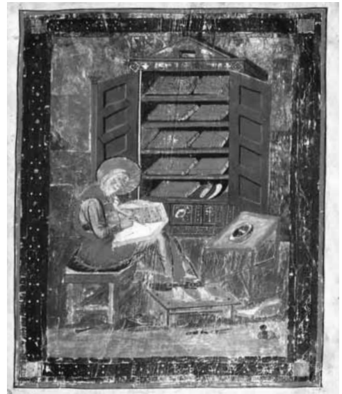
Abbildung entnommen aus: Florentine Mütterich u.a.: Karolingische Buchmalerei, Prestel-Verlag

Die Gleichnisrede zieht bezeichnende Vorgänge in der Natur und bekannte Erlebnisse im menschlichen Dasein heran, um anschaulich zu machen, wie es sich mit dem Himmelreich verhält. Mit dem Himmelreich ist keine jenseitige Wirklichkeit gemeint, sondern das Wirken Gottes an den Menschen und ihre Reaktion darauf angesprochen. Himmel ist eine Umschreibung des Namens Gottes, die der Ehrfurcht Ausdruck verleiht vor dem, der alles Geschaffene überragt. In den Gleichnissen muss man auf Überraschungen gefasst sein, denn sie führen uns sogar „Kluge und Dumme, Waghalsige und Feiglinge und einen beispielhaften Gauner“ (Hermann- Josef Venetz) als Gestalten vor Augen, von denen wir Wichtiges lernen können.