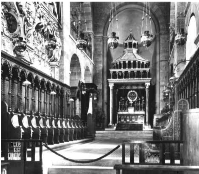
Altarraum der Seckauer Basilika um 1939