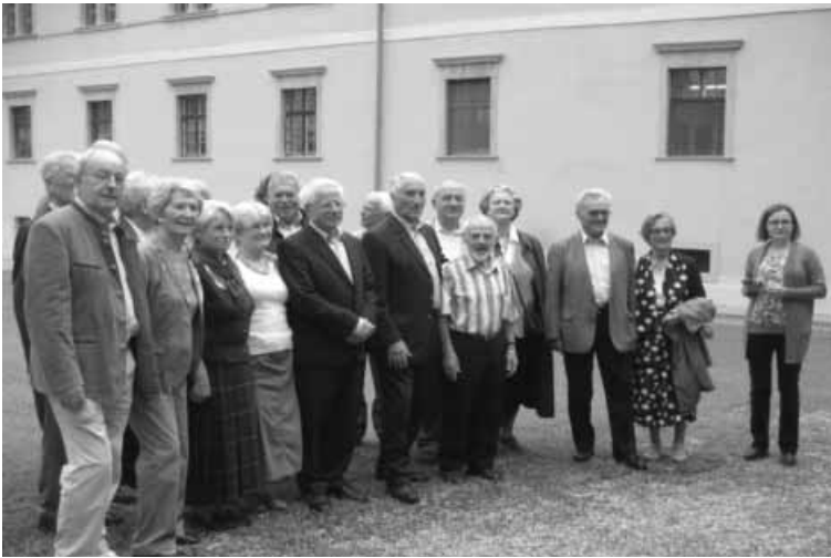
Treffen des Maturajahrgangs 1958 in Seckau