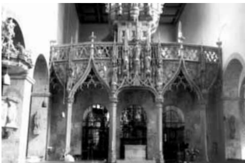
Köln, St. Pantaleon

„Die Basilika war die eindrucksvolle und zukunftssträchtige Leistung der christlichen Baumeister des 4. Jahrhunderts, in der verschiedene, in der römischen Antike schon lange bekannte Bauelemente zu einer neuen Bauform zusammengefügt wurden. Gerade durch ihre Variationsmöglichkeiten war die Basilika geeignet, den vielfältigen liturgischen Anforderungen gerecht zu werden.“ 1) Deshalb ist es nur allzu verständlich, dass sich dieser Bautypus über die Frühzeit der Christenheit hinaus bis in das Mittelalter nicht nur erhalten hat, sondern in den verschiedensten Abwandlungen stets überzeugende Formen entwickelte.