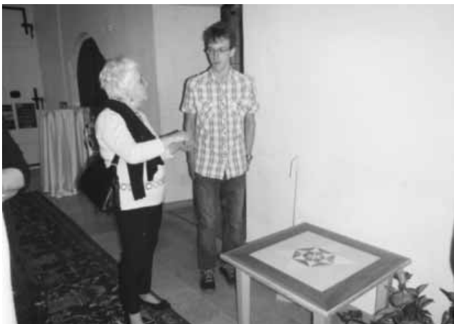
Ausstellungseröffnung der Lehrwerkstätten des AGS beim Hofwirt

„Handwerk hat goldenen Boden“ am Abteigymnasium Seckau. Das Motto „Ora et Labora“ hat für das Gymnasium der Benediktiner eine besondere Bedeutung. So arbeiten die Schüler_Innen der Oberstufe des Abteigymnasiums neben ihrer Vorbereitung zur Matura auch in den Lehrwerkstätten Fotografie, Goldschmiede und Tischlerei. Am Freitag, dem 23. Mai 2014, zeigten die Maturant_Innen erstmals ihre Werkstücke