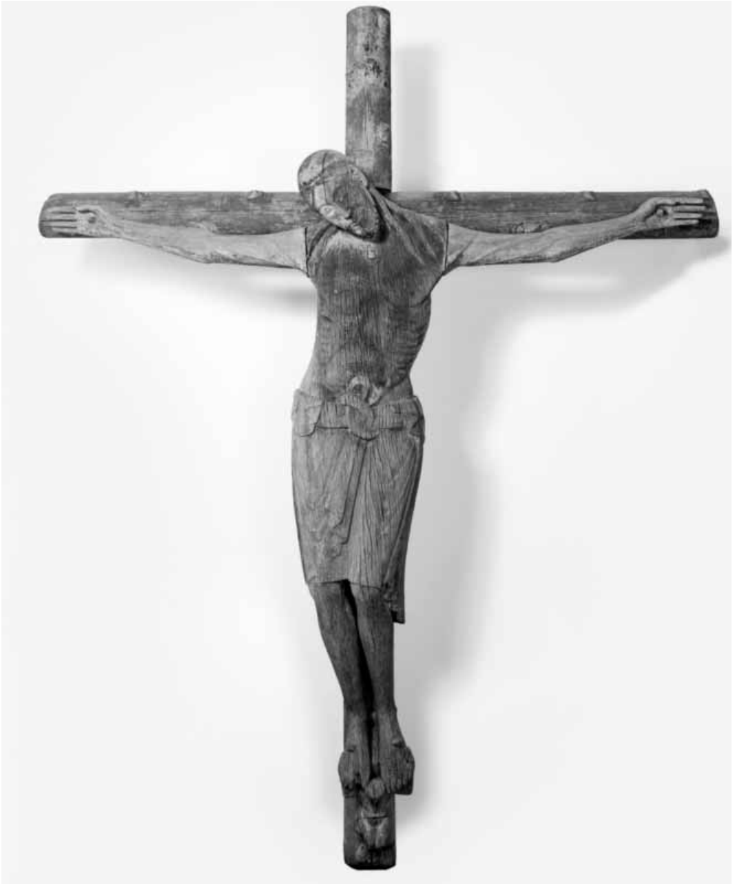
Gaaler Kreuzifix, um 1170 (Tiroler Landesmuseum Ferdinandeum, Innsbruck)

Die optische Zweiteilung der Kirche in Altarbereich und Langhaus wird neben der Erhöhung durch ein schlichtes Detail betont: Lisenen gliedern im Langhaus die Wand vertikal, im Altarbereich gibt es diese Gliederung nicht.