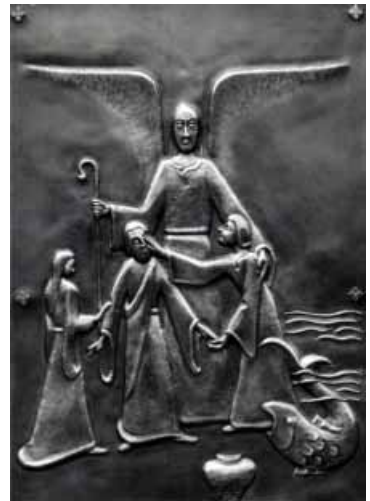
Tobias im Buch Tobit, Detail der Türe zur Basilika Seckau, Prof. Br. Bernward Schmid OSB, 1994

Durch die Vorhalle, die zwischen den Türmen liegt, betritt man die Seckauer Basilika. Ein solcher dem Inneren vorangestellter Raum soll nicht nur die Trennung zwischen dem äußeren und inneren Bereich anzeigen, sondern in erster Linie der Besinnung und Einstimmung auf das Kommende dienen. Der Übergang möchte dazu veranlassen, sich von den Bindungen an das Vorangegangene zu lösen und für die Botschaft zu öffnen, die der Feierraum zu vermitteln hat. Die beiden Löwen, die das Seckauer Trichterportal, eine von außen nach innen sich verjüngende Öffnung, flankieren, haben den Sinn, das Störende, Bedrohliche und Ablenkende von den hindurchgehenden Menschen abzuwehren und fernzuhalten. Die Schwelle, die zum Innehalten einlädt, stellt nicht ein Hindernis im Voranschreiten dar, sie will davor bewahren, gedankenlos darüber hinweg zu gehen und ohne Vorbereitung den Raum zu betreten, in den sie hinein führt. Über ihr wölbt sich der Eingang, der durch eine Tür verschlossen ist und durch das Öffnen den Eintritt freigibt. Im Bogenfeld (Tympanon) oberhalb zeigt die Steinplastik der Mutter Maria mit Jesus, ihrem Kind, an, dass die Abtei- und Pfarrkirche am Fest der Himmelfahrt Marias ihr Patrozinium feiert. Mutter und Kind verbindet zusätzlich die zärtliche Geste des Gebens und Empfangens, da Maria Jesus eine Frucht reicht und von ihm zum Dank dafür am Kinn liebkost wird.