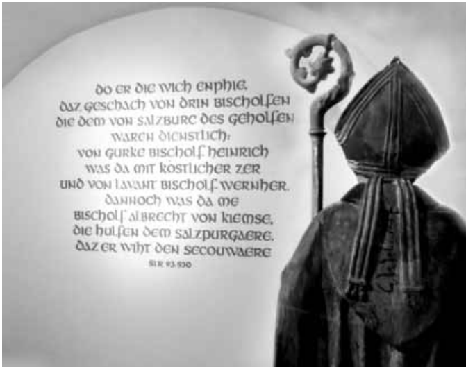
Beschreibung einer Bischofsweihe in Judenburg, Steirische Reimchronik des Ottokar aus der Gaal (Str. 93.530), zu sehen in der „Welt der Mönche“

gekleidet. Da Siegel nicht als Portraits zu verstehen sind, verrät uns die Unterschrift, wer diese Weihe vollzogen hat: HARTMANNUS (D)EI GRA(TIA) BRIXINE(NSIS) EP(IS)C(OPUS) 7)