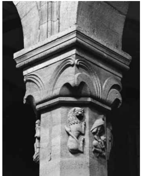
Achteckiger Pfeiler im Hauptschiff der Basilika