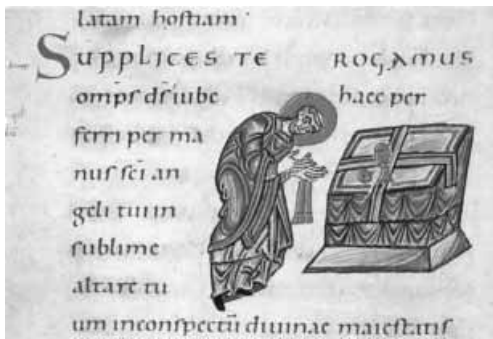
Sakramentar um 1000, Reichenauer Schule, jetzt St. Paul im Lavanttal/Ktn.

beiden Seiten des Mittelschiffes sich hinziehenden Säulenreihen. Sie regen jeden Eintretenden an, den Gang von hinten nach vorne anzutreten, sich vom Eingang zum Altar zu bewegen, vom Westen nach Osten zu gehen. Die Christen bauten ihre Kirchen von Anfang mit der Ausrichtung nach Osten, dem aufgehenden Licht zugewandt, in dem sie das Symbol für Christus, das Licht der Welt, erblickten. Der Westen galt als Ort der Finsternis, des Unheils und der Bedrohung, weshalb man ihn hinter sich lassen musste, um sich dem Licht, das von