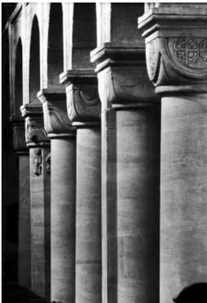
Säulenordnung in der Seckauer Basilika

Um das Jahr 1000 entstand die Kirche St. Michael in Hildesheim, die auf Bischof Bernward zurückgeht. Sie weicht von der aus der Antike stammenden Konzeption ab und stellt eine in mehrfacher Hinsicht beachtenswerte Neuheit dar. Im Grundriss ist sie „eine dreischiffige Basilika mit westlichem und östlichem Querschiff, an deren Frontseiten sich Polygonaltürme mit zylindrischem Aufsatz befinden. Quadratische Mitteltürme erheben sich über den Vierungen.“ 2)