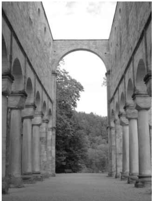
Kirchenschiff von Paulinzella im Rottenbachtal in Thüringen

Kirchen, die von der Hirsauer Reform beeinflusst wurden, sind besonders in Sachsen und Thüringen zahlreich gewesen (heute besonders beeindruckend: Hammersleben und die Ruine Paulinzella, die auch sehr ähnliche Kapitelle wie Seckau zeigt.). Dieser Baustil zeichnet sich durch große Einfachheit des Baus aus, die Kirchen haben eine flache Holzdecke, keine Krypta und mächtige Würfelkapitelle 3 ). Obwohl Hirsau im Einflussbereich der clu-