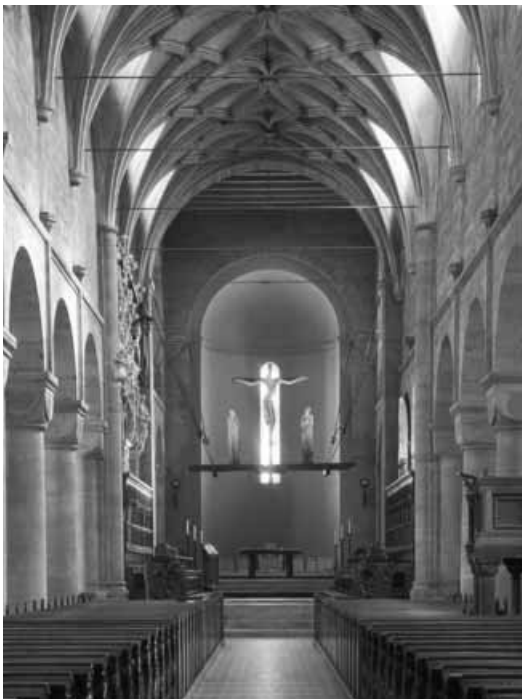
Innenansicht der Seckauer Basilika

Inwieweit Erzbischof Konrad I. für seine Klosterkirchen eine Idealform festgelegt hat, ist nicht nachzuvollziehen, da nur die Klosterkirche von Seckau weder zerstört noch barockisiert wurde. Betrachtet man aber die Biografie Konrads, hat er sicher viele Einflüsse aus seinem Lebensweg mitgenommen. Bereits in Hildesheim, wo er wohl im Mariendom in die Domschule ging, haben wir eine dreischiffige Basilika mit niedersächsischem Stützenwechsel – also dem Wechsel zwischen zwei Säulen und einem Pfeiler – wobei auch der Dom ein Querhaus und einen Chorumgang hat.