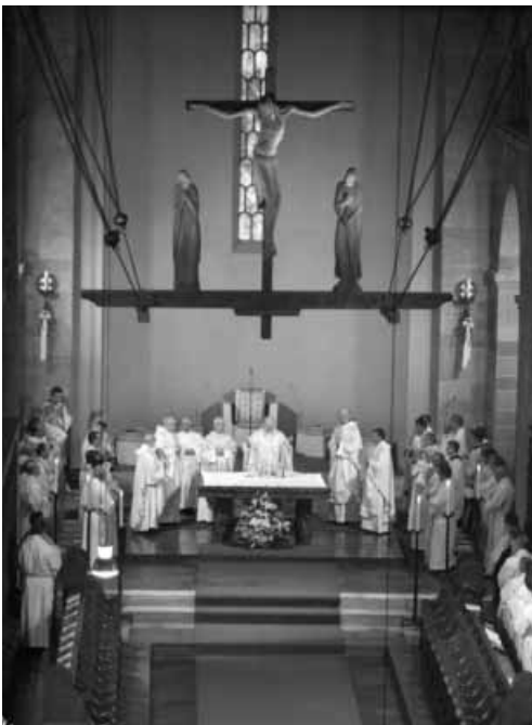
Feierliche Messfeier am Seckauer Hochaltar

Der Weg, der mit dem Betreten der Kirche beginnt und entlang der Säulen nach vorne führt, erreicht sein Ziel, wenn er am Altar ankommt. „Sende dein Licht und deine Treue! Sie sollen mich leiten, sie sollen mich führen zu deinem heiligen Berg und zu deiner Wohnung. Dann will ich hintreten zum Altar Gottes, zum Gott meiner jauchzenden Freude.“ 8) Die Sehnsucht des Menschen, der in der Ferne nichts anderes verlangt, als die Nähe Gottes zu erleben, kommt zur Erfüllung, wenn er sich der Führung des Lichtes anvertraut, das ihn an das Ziel führt, zum Tempel in Jerusalem. Dort darf er die Gegenwart Gottes spüren. Mit Recht kann man behaupten, dass eine Kirche wegen des Altars erbaut wird, da er die geistige Mitte bildet und alles auf ihn ausgerichtet ist. „Weil am Altar die Gedächtnisfeier des Herrn begangen wird und den Gläubigen sein Leib und sein Blut gereicht werden, haben die Kirchenschriftsteller im Altar ein Sinnbild für Christus gesehen. Daher hat man gesagt: Der Altar ist Christus.“ 9)