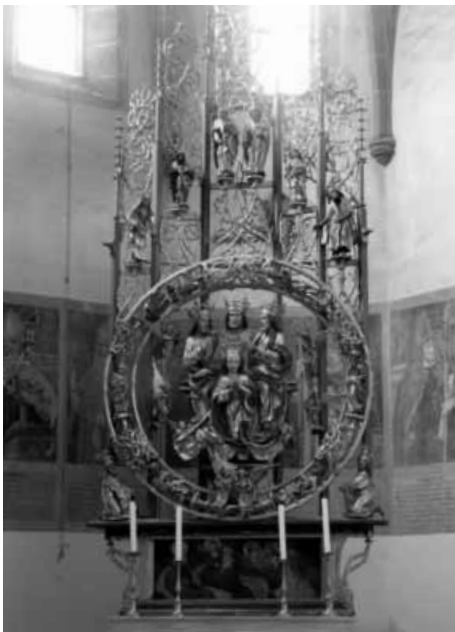
Mariä Krönungsalter, heute in der Bischofskapelle

Schon bevor die Kirche des Chorherrenstiftes ihre endgültige Gestalt erhalten hatte, sind mindestens zwei Altäre errichtet und geweiht worden, wie dies durch die Erwähnung in Urkunden bezeugt ist. Bischof Hartmann von Brixen konsekrierte 1164 die Klosterkirche mit einem „öffentlichen Altar“ (cum altere publico), worunter höchstwahrscheinlich der Hauptaltar zu verstehen ist. Über sein Aussehen gibt es keine Berichte. Es ist bloß überliefert, dass er den Heiligen Drei Königen geweiht war. Das Wachssiegel des Konsekrators ist als einziger handgreiflicher Anhaltspunkt, historisches Dokument, auf uns gekommen. Der romanische Altar blieb bis um 1600 erhalten, als man ihn wegen seines schadhaften Zustandes durch eine barocke Neuschöpfung ersetzte, die vom Hofbildhauer Sebastian Carlone geschaffen wurde. Die Anbetung der Weisen aus dem Morgenland fand auch auf diesem Altar einen würdigen Platz im Mittelfeld. Der gelehrte und eifrige Stiftschronist Matthias Ferdinand Gauster hatte im 18. Jahr-